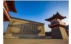
陕西西安兵马俑博物馆“西为东望”上横刻的“横道四句”，图源：“宝鸡文苑”微信公众号

张载十分重视主体自我的“成天地之道，辅相天地之宜”的多重化育之功，因此于四句之首，特别拈出一个“立”字，以凸显人之挺立生命价值，主动参与宇宙生生的大情怀。